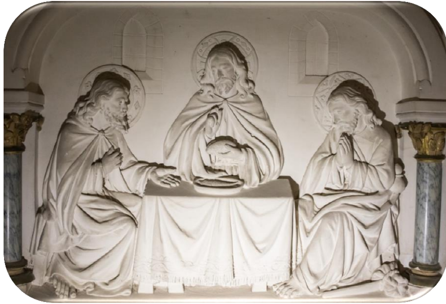
Les disciples d'Emmaüs